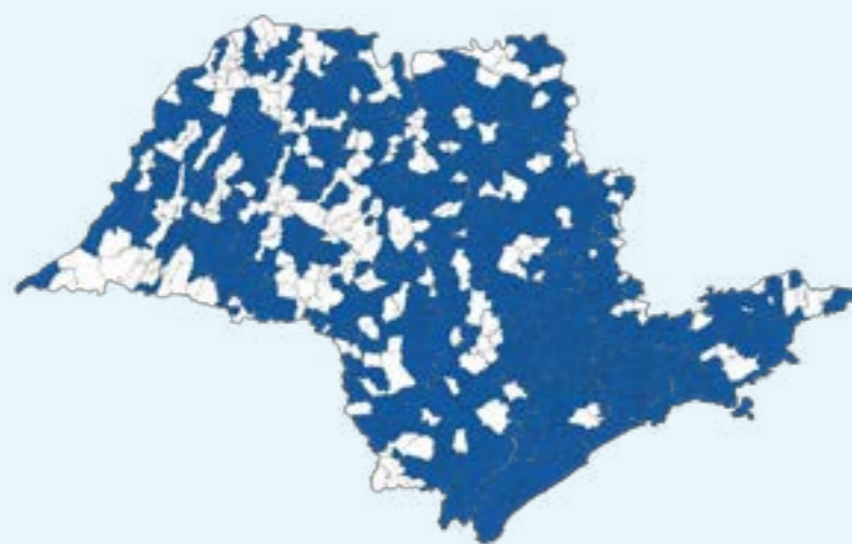
Figura 1 – Mapa de atuação do Desenvolve SP

Neste semestre, o saldo da carteira de crédito da instituição alcançou R$ 2.260,6 milhões, o que representa um crescimento de 6,5% quando comparado a 06/2022. A Desenvolve SP está presente em 63% das cidades paulistas, com pelo menos uma operação ativa.